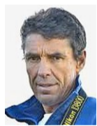
Robert Bösch Der 1954 in Schlieren geborene Fotograf ist diplomierte Geograf und Bergführer.

Es sind Bilder, bei denen man die Luft anhält. Was für ein Zufall, was für ein Moment, was für Kontraste! Für Bösch sind es solche Momente, die aus einem guten Bild ein ausgezeichnetes machen. Bilder, die das besondere Etwas haben, das sie aus dem Erwartbaren heraushebt in eine Sphäre der Exzellenz.