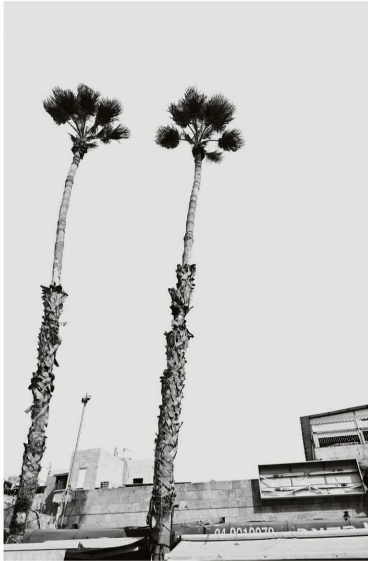
Das Ungewöhnliche im Alltäglichen: Palmen in Akko, Israel.

Da sehen wir den Extremsportler Ueli Steck, der als roter Winzling in einer mächtigen, sich über zwei Buchseiten erstreckenden Eiswand emporklettert. Oder den Piloten samt Hängegleiter, der vor einer prächtigen Bergkette schwebt und dabei mit seinem Stoffflügel nur ganz kurz