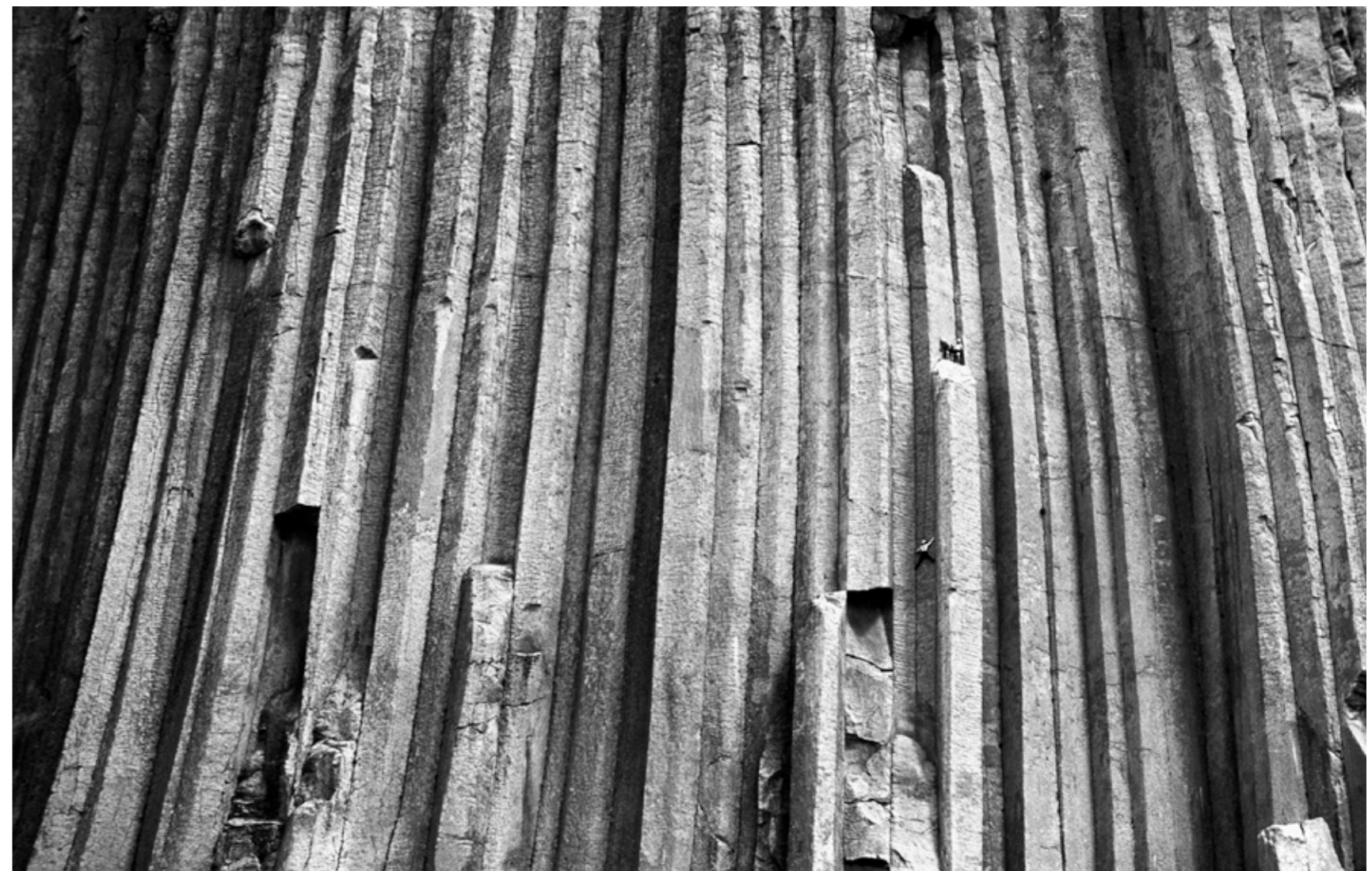
Kletterer am Devils Tower, Wyoming, USA.