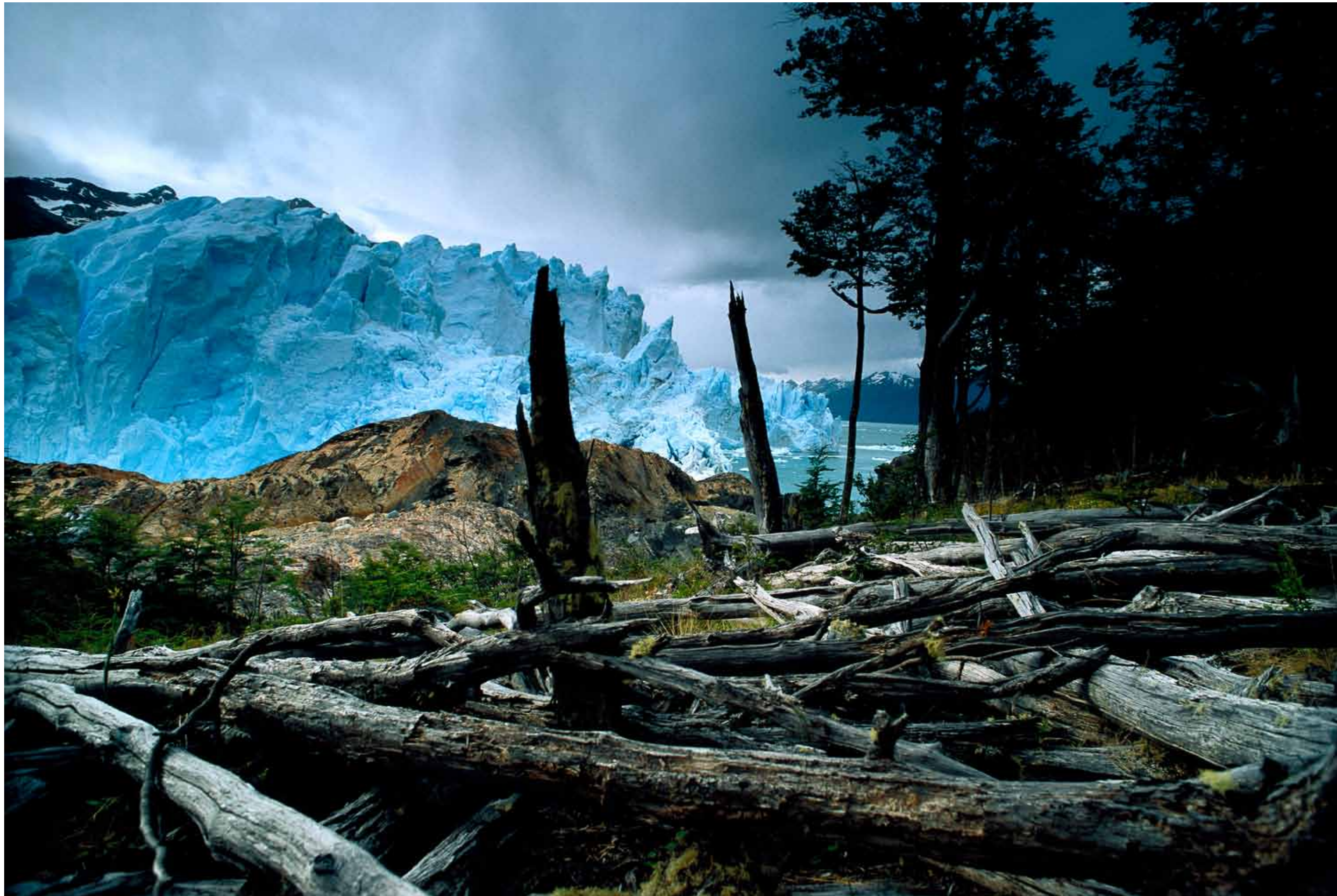
Glaciar Perito Moreno, Patagonien, Argentinien.