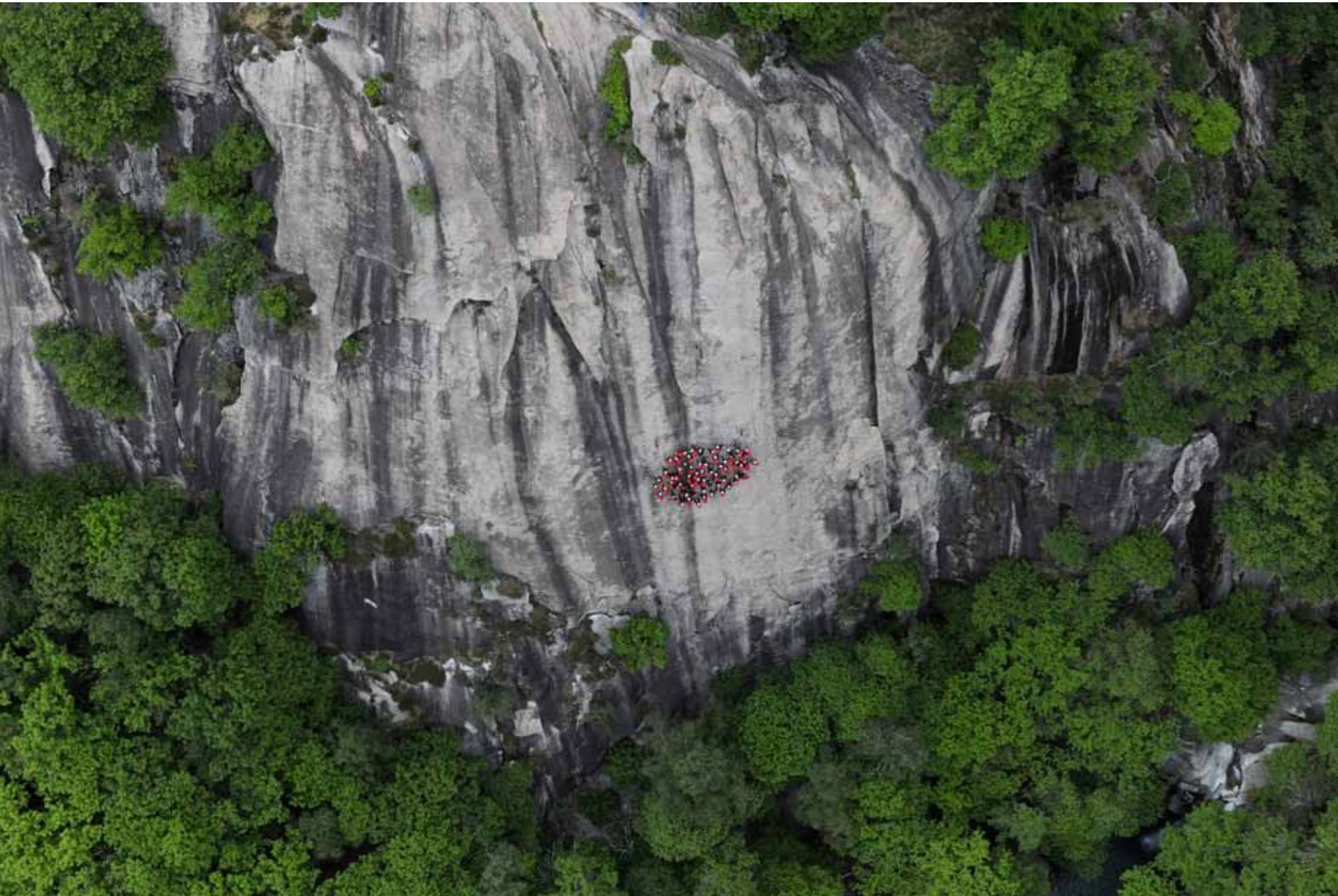
Anlässlich eines Shootings für die aktuelle Mammut-Kampagne; Osogna, Tessin, Schweiz.

Der Innerschweizer Fotograf Robert Bösch hat sich auf Outdoor- und Actionfotografie spezialisiert und gilt als Ikone auf seinem Gebiet. Seit 20 Jahren bereist er Orte, an die sich nur wenige trauen: Sechs-, Sieben- und Achttausender. Am Donnerstag, dem 28. Oktober, zeigt er im neuen Kunstraum für Geniesser im zürcherischen Zwillikon seine neuesten Bilder (mehr Infos unter www.rolandoehler.ch ).