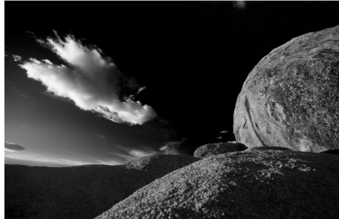
Sierra Nevada, Bishop, California, USA.